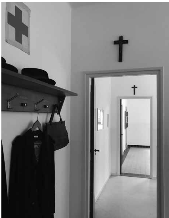
Ingang en wachtkamer Groene Kruisgebouw Wessem.