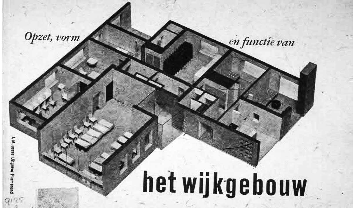
Opengewerkte indeling van een wijkgebouw, Stichting Federatieve Commissie voor de Kinderhygiëne in Zuid-Holland, 1955 (collectie Florence Nightingale Instituut, nr. D0143).