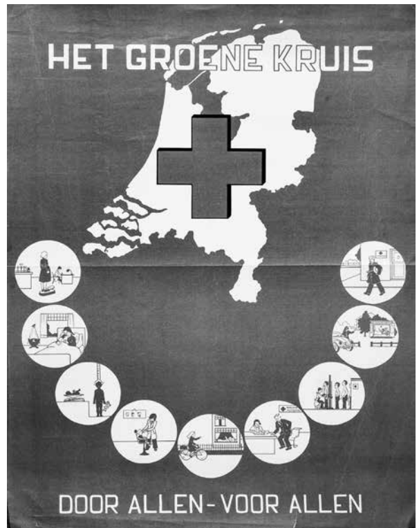
Affiche van het Groene Kruis met daarop afgebeeld alle taken (datering onbekend, collectie Florence Nightingale Instituut).

kruisbeeldjes in de verschillende ruimtes en de katholieke zuster bij de ingang met de Solex aanwezig zijn? Is dit een historische fout? Nee, dit wijkgebouw is correct weergegeven, maar hoe en waarom wordt in dit artikel duidelijk.